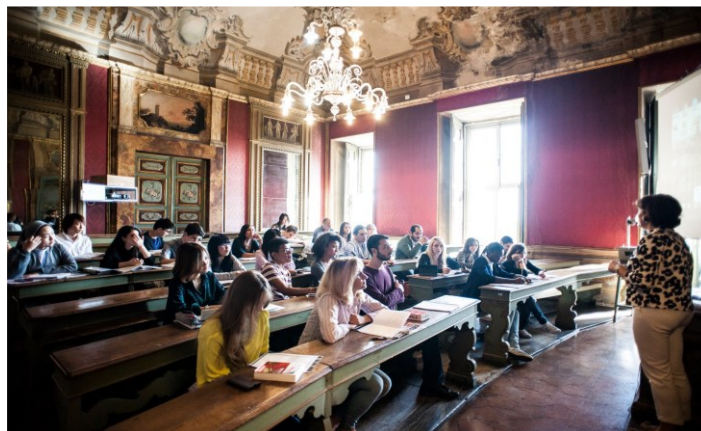
Partenza dei partecipanti